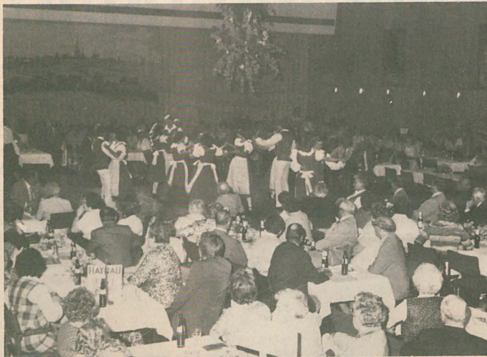
In blau-weißen Kostümen, den Farben Pommerns, tanzten die älteren Mitglieder der Solinger Volkstanzgruppe Pommern im großen Saal des Solinger Konzerthauses am Samstagabend des bunten Abends.