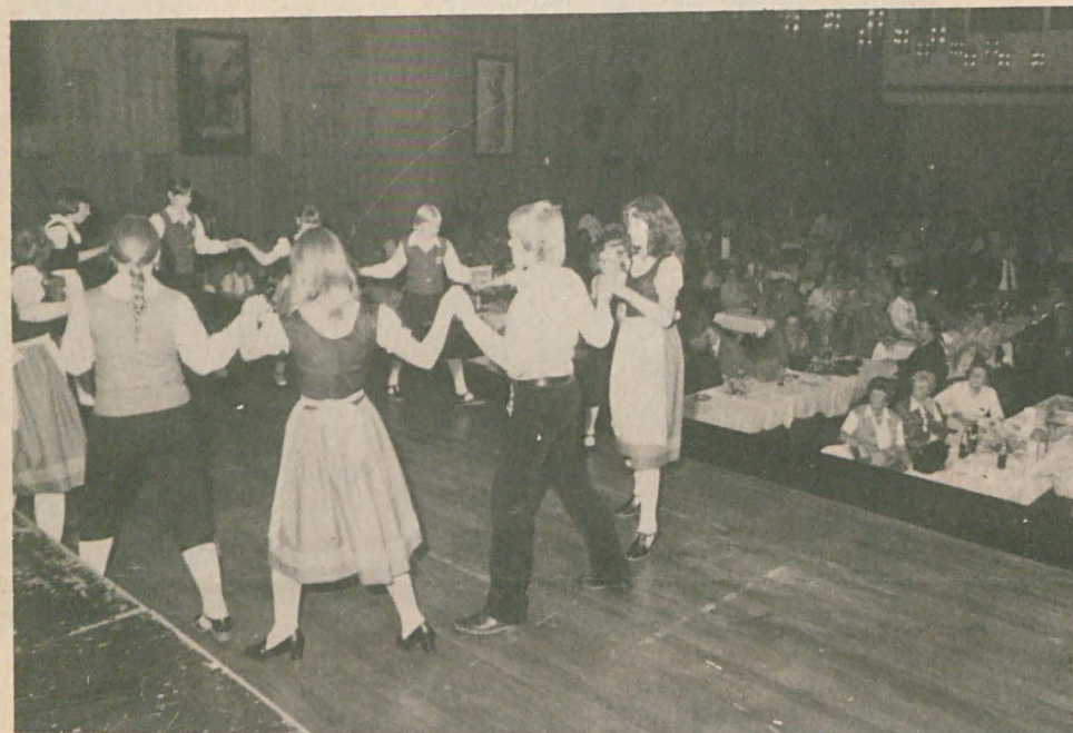
Die „Kleinen“ der Volkstanzgruppe trugen die Arbeitstracht des Pyritzer Weizackers. Die Trachten wurden von der Nähgruppe der Pommerschen Frauengruppe selbst geschneidert.