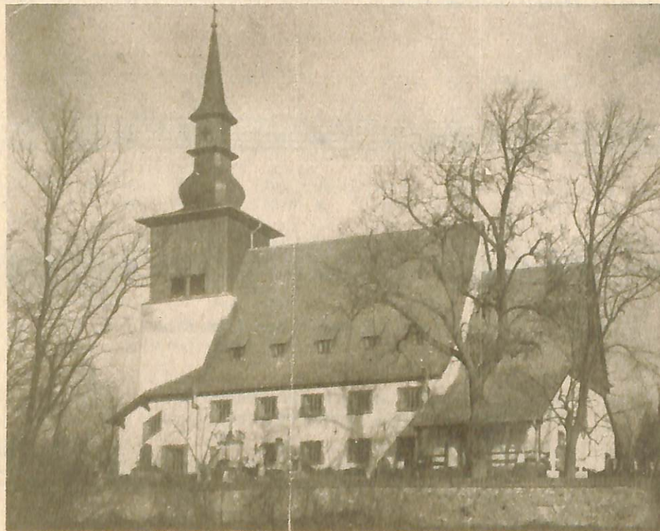
Bild 3. Die Kirche in Altenlohm. Langseite

zu beziehen durch die Goldberg-Haynauer Heimatnachrichten