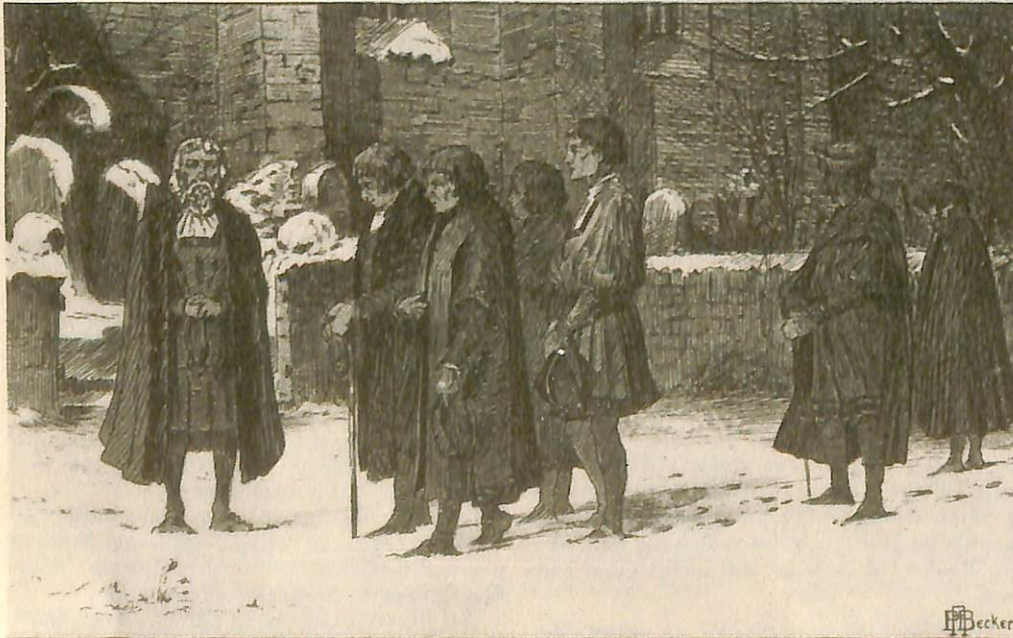
Die sieben letzten Bürger Goldbergs 1555