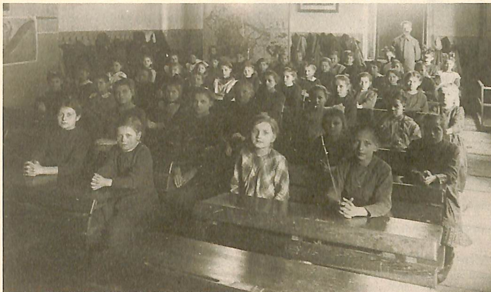
Schulbild aus dem Jahre 1920 oder 1921.

Irrtümlich wurden in unserer November-Ausgabe falsche Kontonummern angeführt.