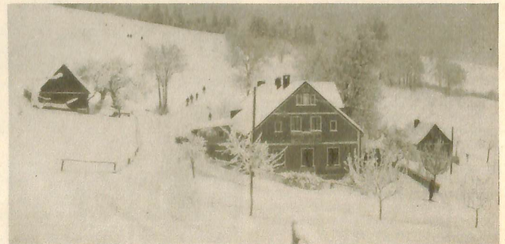
„Die Schaffbergbaude“, Inh. Wilhelm Geisler.