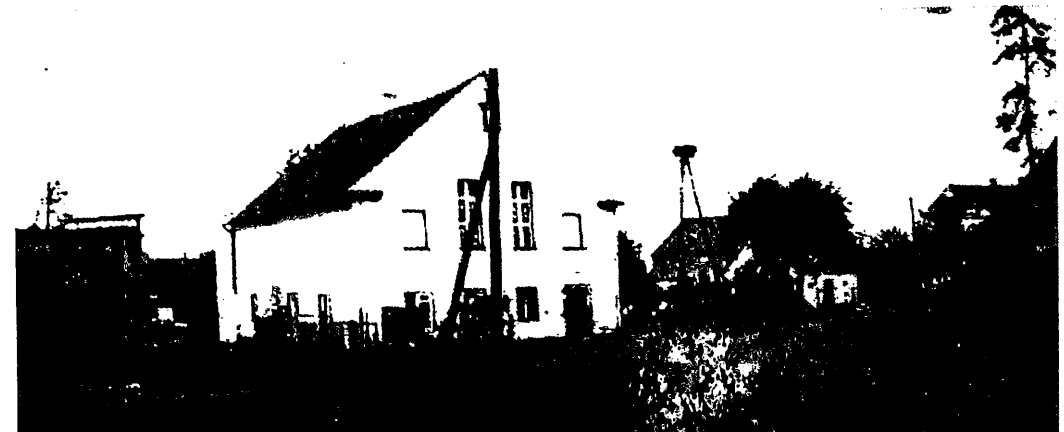
Richter's Gasthaus. — Beide Aufnahmen sind aus dem Jahre 1991 und wurden von Frieda Zimpel geb. Klose, 5226 Reichshof-Wildbergerhütte, Welpersiefen 11, eingesandt.