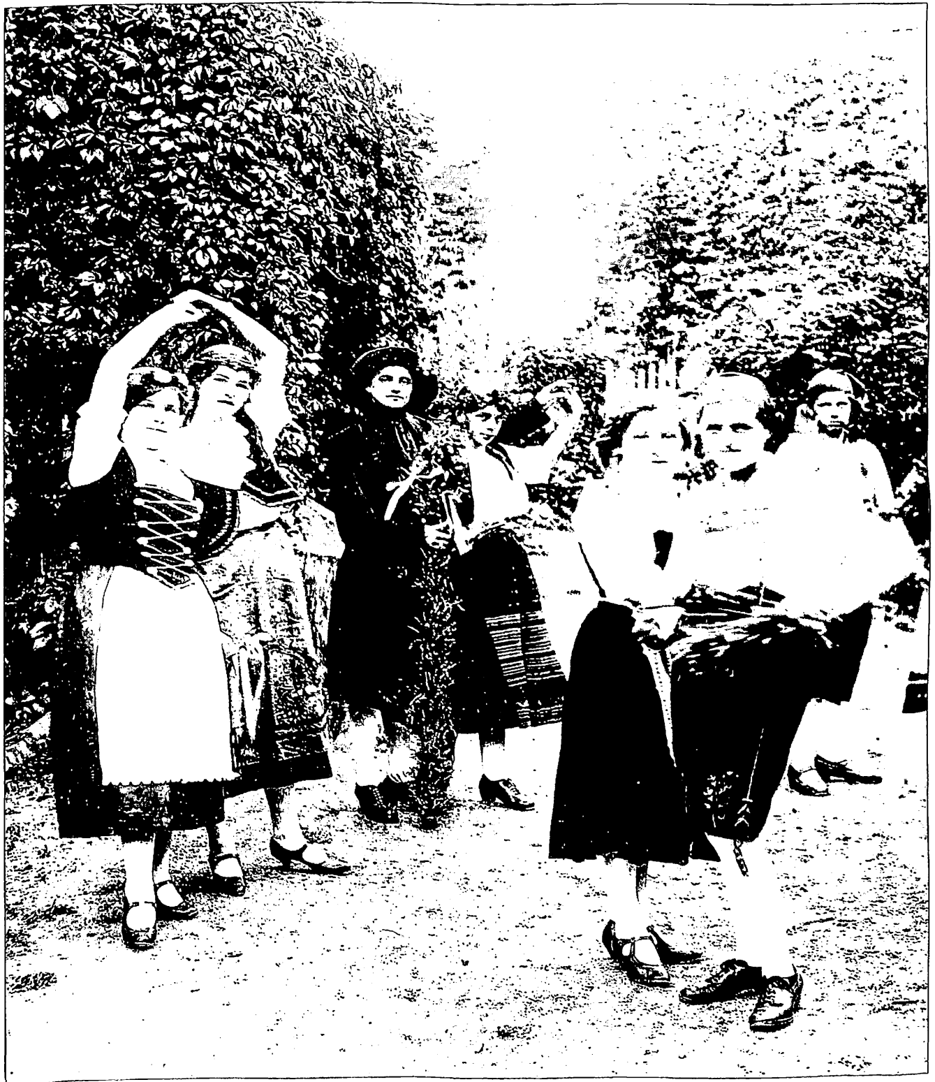
Beim Erntetanz 1923 in Kauffung entstand dieses Bild, es wurde das »Lied der Glocke« aufgeführt. Wir entdeckten das Bild im Archiv der »Goldberg-Haynauer Heimatnachrichten«.