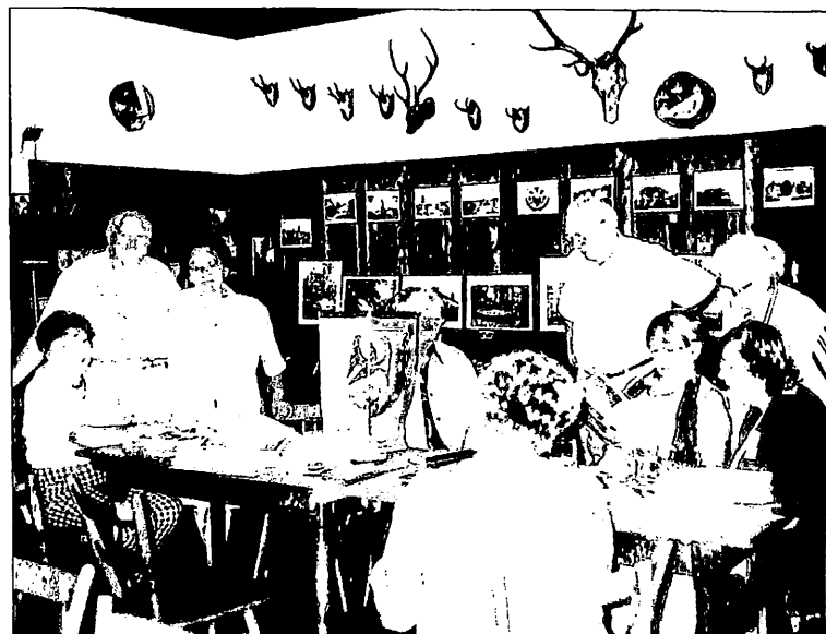
Am 5. September 1999 trafen sich die Goldberger Heimatfreunde aus München in Nürnberg.