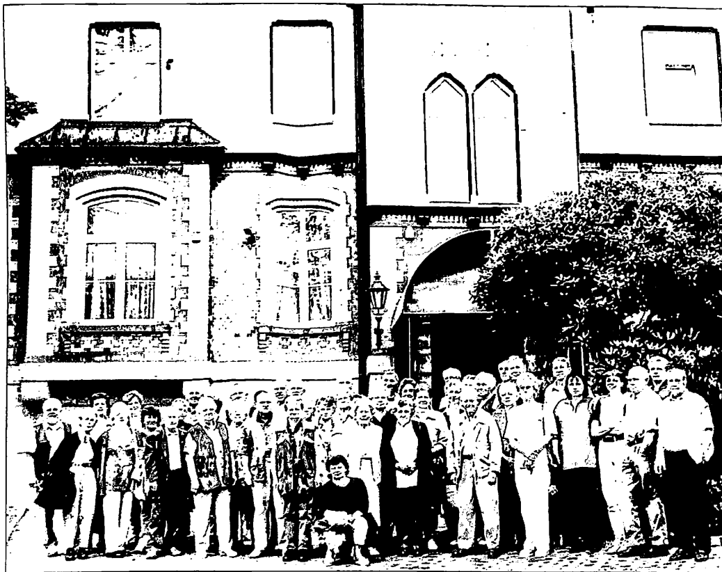
Die Hohenliebenthaler waren vom 5. bis 9. September 1999 zu Hause.

Am Nachmittag war die Rückfahrt über Schönau mit einem letzten Blick auf die Hogolie von Weitem. In Schreiberhau besuchten wir das Museum mit Mineralien, Schnitzereien, Glas und Kristall.