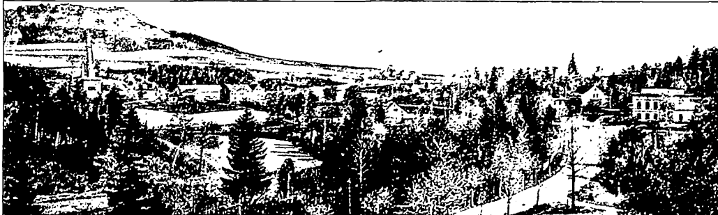
Blick Hermannsdorfer H.

Die Heimatgemeinschaften und der Heimatverlag wünschen allen Geburtstagskindern und Jubilaren für Gesundheit und Wohlergehen alles Gute. Den Kranken baldige Genesung und für den weiteren Lebensweg herzliche Wünsche. Wir hoffen, daß alle Altersjubilare, besonders die, von denen wir über das Wohlergehen kaum etwas erfahren, gesund sind.