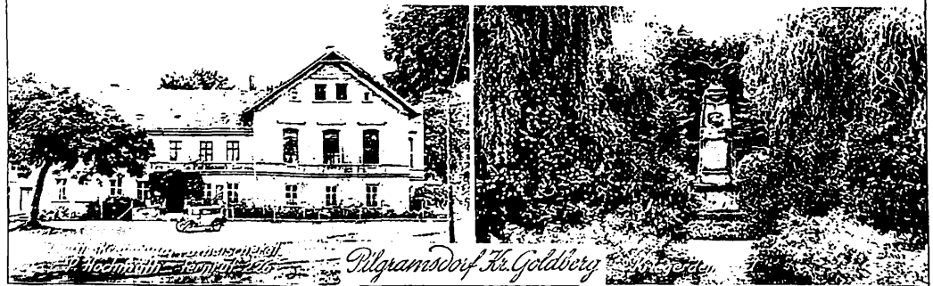
Blick auf das Pilgramsdorfer Mitteldorf 1930.