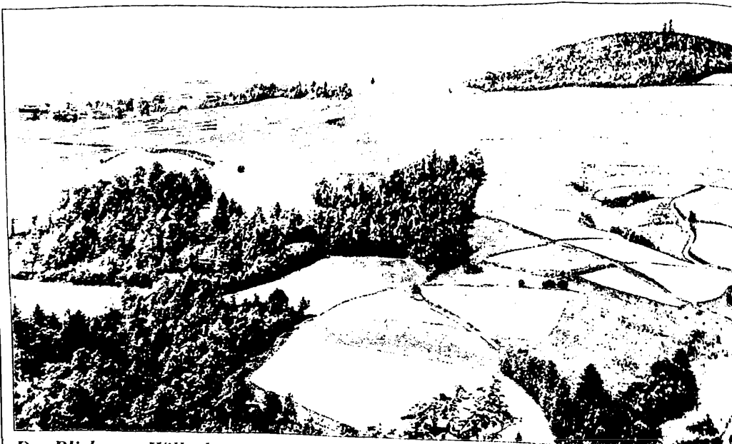
Der Blick vom Willenberg nach Falkenhain und zum Probsthainer Spitzberg war unvergleichlich schön. Heute kann man nicht mehr auf den Willenberg steigen, da alle Wege zugewachsen sind.

Autobahn von Liegnitz bis zu unserer Abfahrt bei Oppeln ist eine Katastrophe. In Oberglogau gab es dann Gewitter und Regen. Unser kleines Hotel war sehr gut und auch das Essen vorzüglich. Mein Vater war Majoratsverwalter bei Graf von Oppersdorff und wir wohnten in einem Flügel des Schlosses. Als Kind spielte ich mit den Söhnen. Das Schloß ist leer, etwas kaputt und ein Teil dient als Möbellager. Im Park, der einigermaßen gut erhalten ist, fanden wir auch den See, auf dem ich Schlittschuh lief. Am Nachmittag gingen wir in das kleine Museum. Zwei Damen leiten es und waren sehr freundlich und hilfsbereit. Eine Dame führte uns auch in die Räume des Schlosses, und sogar durch unsere alte Wohnung. Da die Wände herausgerissen waren und es