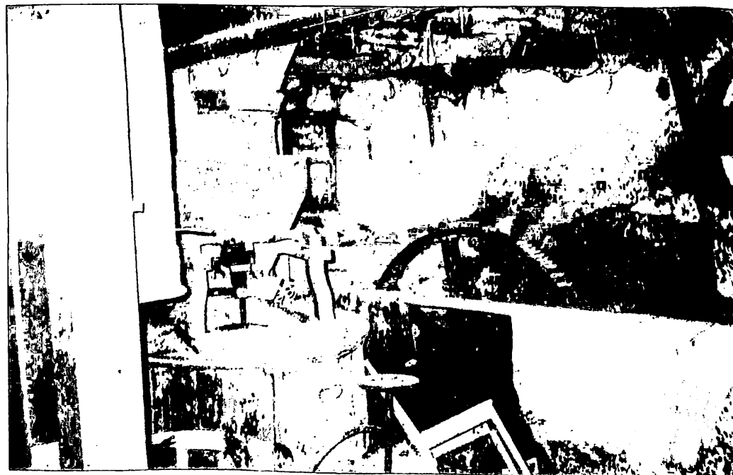
Zwischen altem Gerümpel stand in der Schloßmühle in Falkenhain noch so manches Gerät, das an den alten Mühlenbetrieb erinnerte.