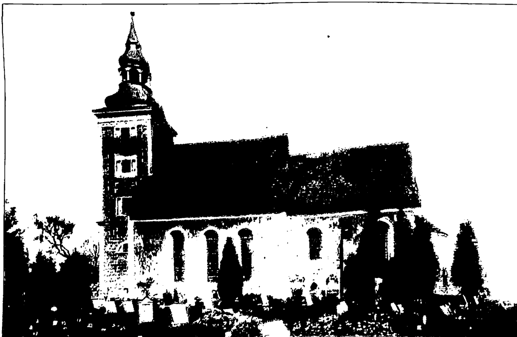
Die Lobendauer Kirche.

Der Orden, zwei silberne Palmblätter mit einem lila Band, wird für besondere kulturelle und wissenschaftliche Leistungen verliehen. Er wurde bereits 1808 durch Napoleon I. gestiftet.