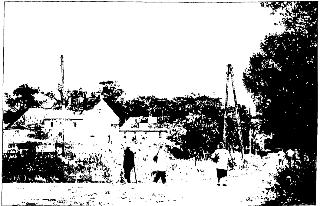
Die Brockendorfer besuchten ihre Heimat. Vom Bahnhof kommend, wanderten sie an der ehemaligen Gärtnerei Michael durch das Oberdorf.

So berichtet die »Gazeta Chojnowska« (Haynauer Zeitung) Nr. 27 vom 3. Juli 1998 auf über einer Seite ausführlich und positiv über den Besuch ehemaliger Einwohner