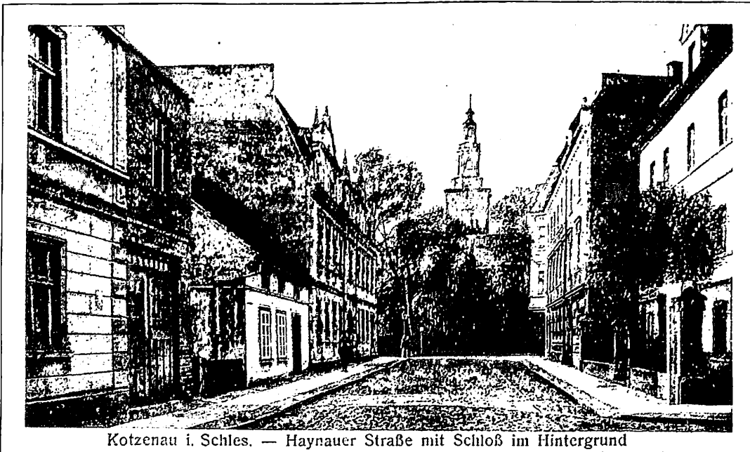
Kotzenau i. Schles. — Haynauer Straße mit Schloß im Hintergrund