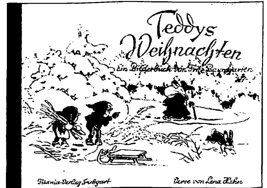
Teddys Weihnachten Ein Bilderbuch von Fritz Baumgarten Mit Versen von Lena Hahn 24 Seiten, farbig, Hochglanzumschlag DM 16,80/EURO 8,60