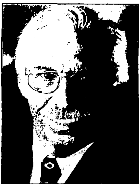
Franz Haug Oberbürgermeister

In diesem Sinne wünsche ich Ihnen frohe Weihnachtssttage und ein gutes, gesundes, vor allem aber auch friedliches Jahr 2002.