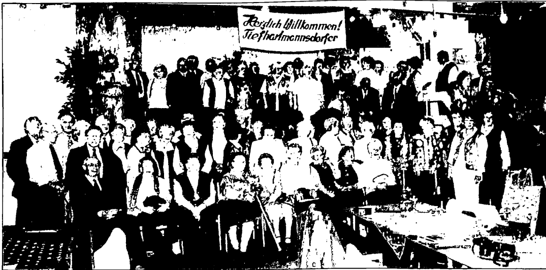
Tiefhartmannsdorfer Treffen am 13. Oktober 2001 in Bielefeld.