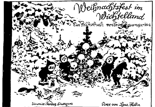
Weihnachtsfest im Wichtelland Ein Bilderbuch von Fritz Baumgarten Mit Versen von Lena Hahn 24 Seiten, farbig, Hochglanzumschlag DM 16,80/EURO 8,60

Unserer heutigen Ausgabe liegt die Bezugsgeldrechnung für 2002 bei.