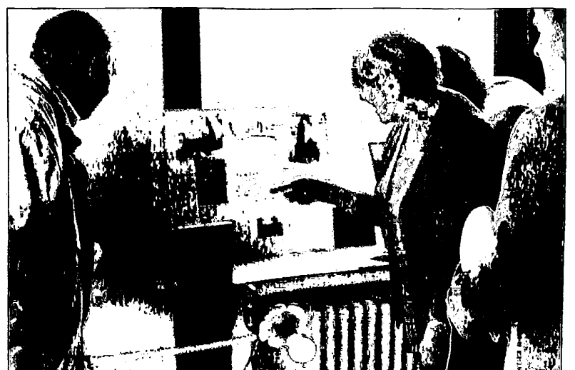
Dieser Leuchter stammt aus der Goldbergger Stadtpfarrkirche. Uli Kabel brachte ihn von seinen Streifzügen durch seine Geburtsstadt mit nach Solingen.