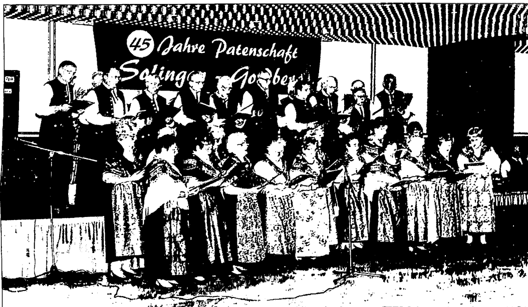
Der Chor der Oberschlesier in Solingen nahm die Besucher des Heimatabends mit auf eine musikalische Weltreise und zu einem gemeinsamen Singen schlesischer Volkslieder. In ihren Farbenfrohen Trachten bildeten die Sänger einen besonders hübschen Anblick.