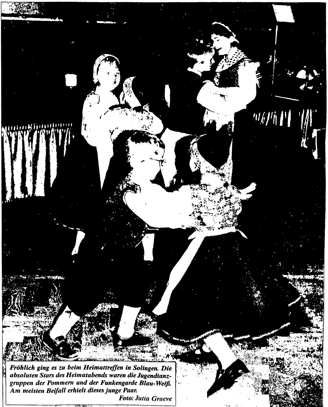
Fröhlich ging es zu beim Heimattreffen in Solingen. Die absoluten Stars des Heimatabends waren die Jugendtanzgruppen der Pommern und der Funkgarde Blau-Weiß. Am meisten Beifall erhielt dieses junge Paar.