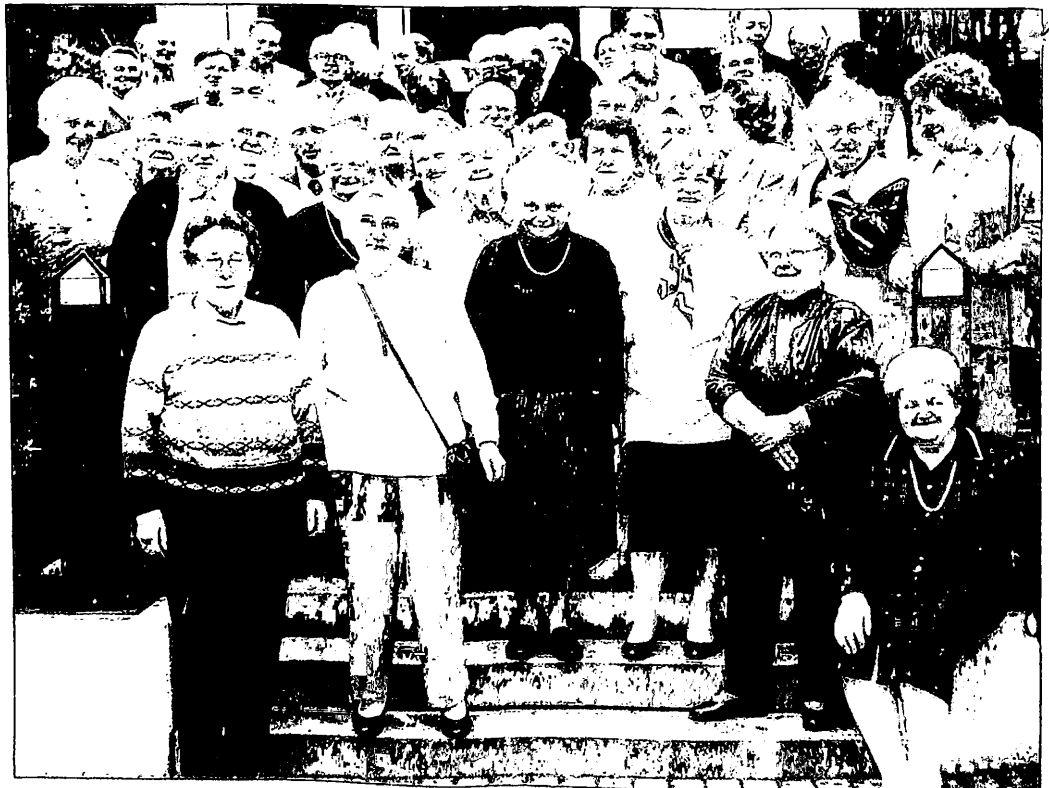
Teilnehmer beim Alt-Schönauer Ortstreffen am 15. April 2000 in Bielefeld.