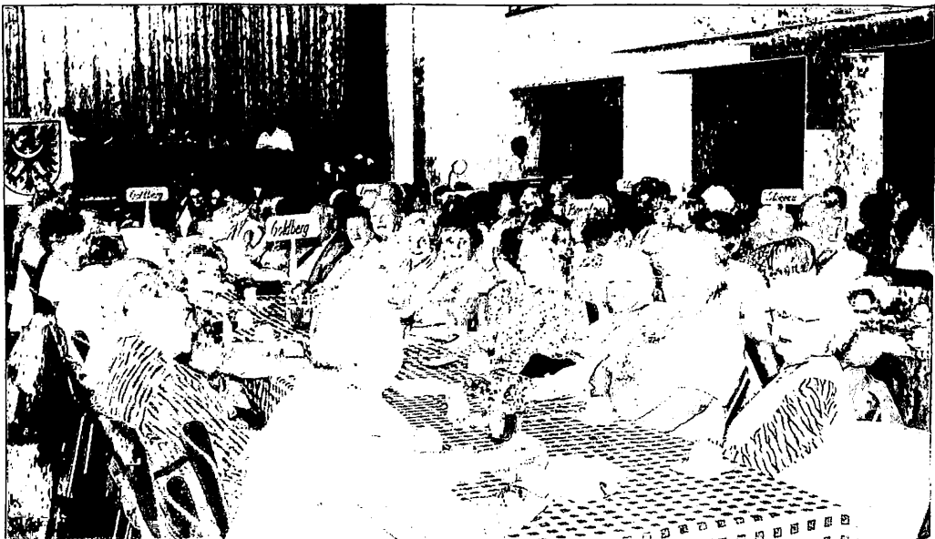
Viel Spaß hatten die Schlesier beim kulturellen Nachmittag in Bielefeld, zu dem die Kreisgruppe Bielefeld der Landsmannschaft Schlesien eingeladen hatte. Die Gruppe des Kreises Goldberg gehört dabei zu den aktivsten der Kreisgruppe.