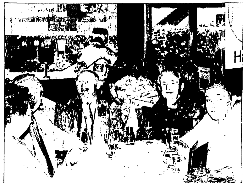
Der Männerrat der Haynauer erzählte gewiß von alten Schulstreichen, jedenfalls konnte man das den fröhlichen Gesichtern entnehmen.