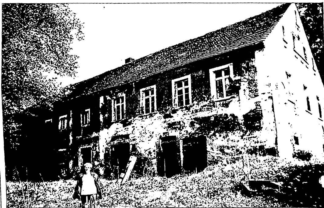
Im Gasthaus Rücker können sich die Ludwigsdorfer leider nicht mehr treffen, es sieht wenig einladend aus.