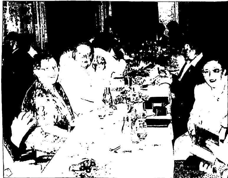
Die Goldberger waren in diesem Jahr wohl die am stärksten vertretene Gruppe in Solingen.