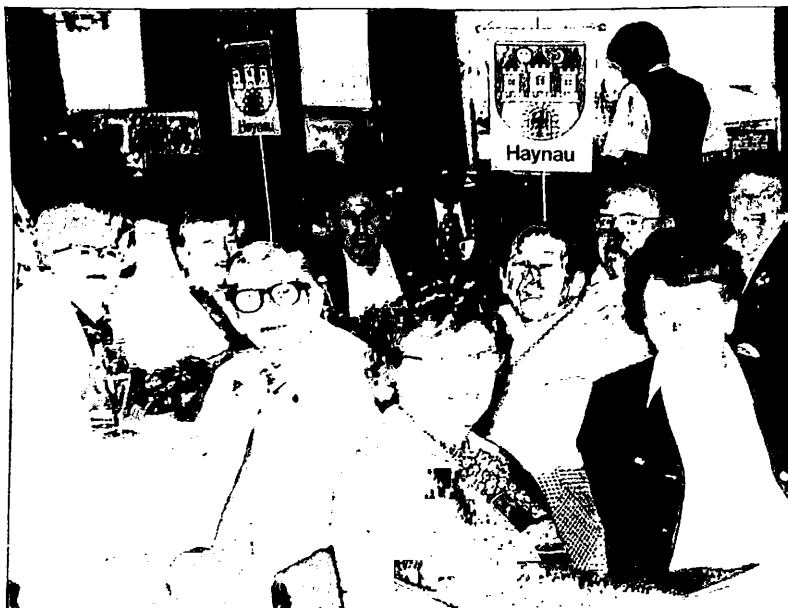
Bei den Haynauern ging es wie immer sehr fröhlich zu und sie waren mit ihren bunten Ortsschildern schnell zu finden.