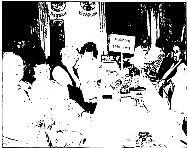
Die Goldberger waren so zahlreich vertreten, daß sie sich sogar jahrgangsmäßig zusammensetzten.