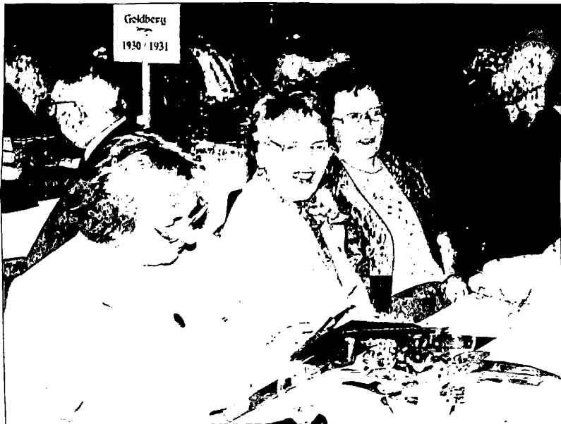
Fotoalben, Landkarten und viele Erinnerungen wurden mitgebracht. Insgesamt war es ein sehr fröhliches Heimattreffen.