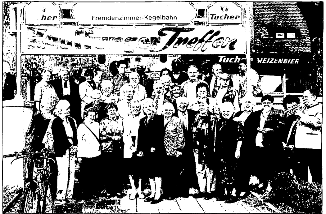
Viel Freude machte das Treffen am 21. Und 22. Oktober den Kauffungern in Nürnberg. Viele alte Freundschaften wurden erneuert.

Ach ja, die Kollekte betrug 540,- Euro. Und das, meine ich, ist für 83 Kauffunger ein tolles Ergebnis!