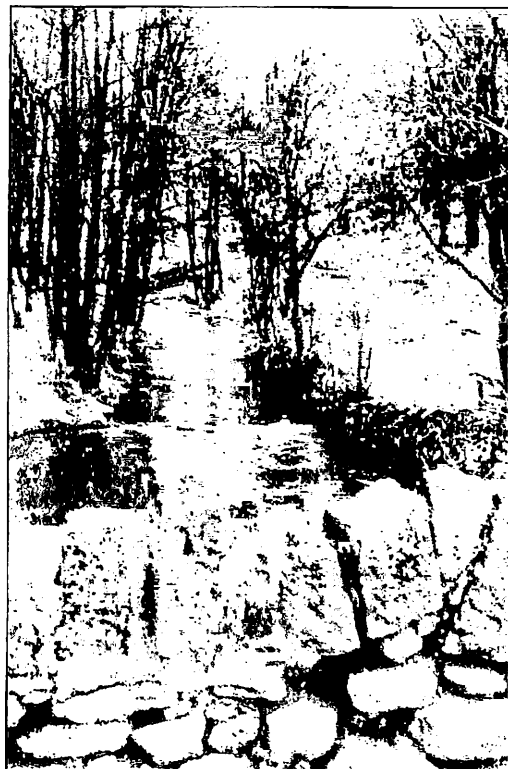
Der Steinbach mündete in Schönau in die Katzbach. Unser Bild zeigt ihn beim Durchfließen der Aue. Links im Bild aber nicht zu sehen, blühte an dieser Stelle im Frühjahr ein kleiner Berg voller Veilchen.