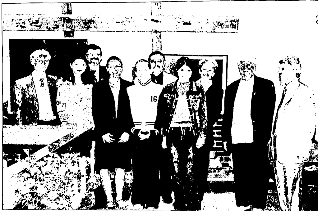
Der Vorstand des Vereins mit seinem Helfern im Zentrum:

Außerdem entstand ein Stadtführer durch Goldberg und als vorerst letzte Ver- öffentlichung zwei Bildbände von Gold- berg unter dem Titel „Früher und heute“. Sie zeigen historische Postkarten vor 1945