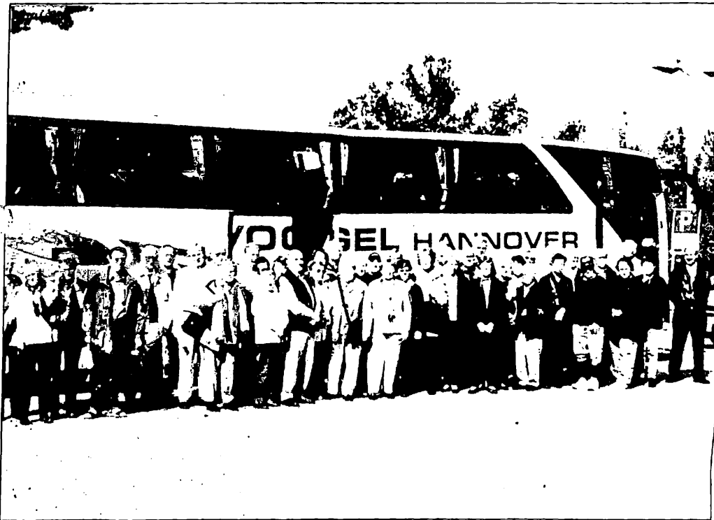
Auch im Jahr 2003 wird es wieder eine Leserreise nach Schlesien geben. Unser Bild zeigt die Reisegesellschaft der Leserreise 2002.

ten schlesischen Klöster Trebnitz, Leubus oder Grüssau vorgesehen. Hierbei richten wir uns nach den Wünschen der Reiseteilnehmer. Mit im Programm ist eine Fahrt ins Riesengebirge, bei schönem Wetter mit Wanderung. Die Reiseleitung übernimmt wieder Jutta Graeve. Anmeldungen ab sofort bei den GOLDBERG-HAYNAUER HEIMATNACHRICHTEN.