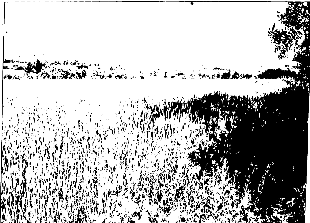
Im August laden die Goldberg-Haynauer-Heimatsnachrichten wieder zu einer Leserreise ein. Dann sollen wieder Ziele im Kreis, aber auch Breslau, das Riesengebirge und Kloster Grüssau besucht werden. Unser Bild zeigt den Probsthainer Spitzberg zur Sommerzeit vom Effnerts Kreuz aus.