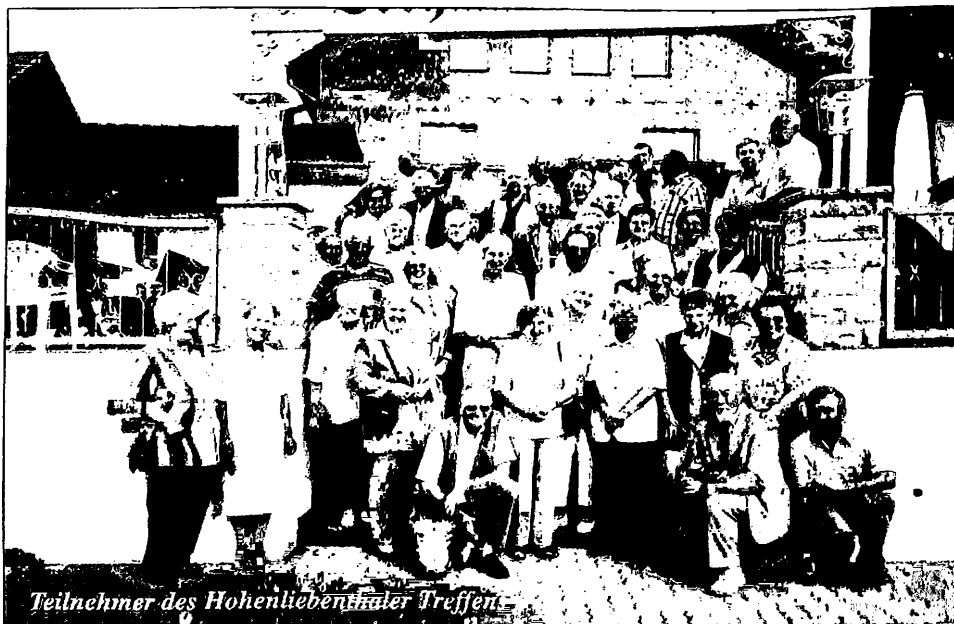
Teilnehmer des Hohenliebenthaler Treffens