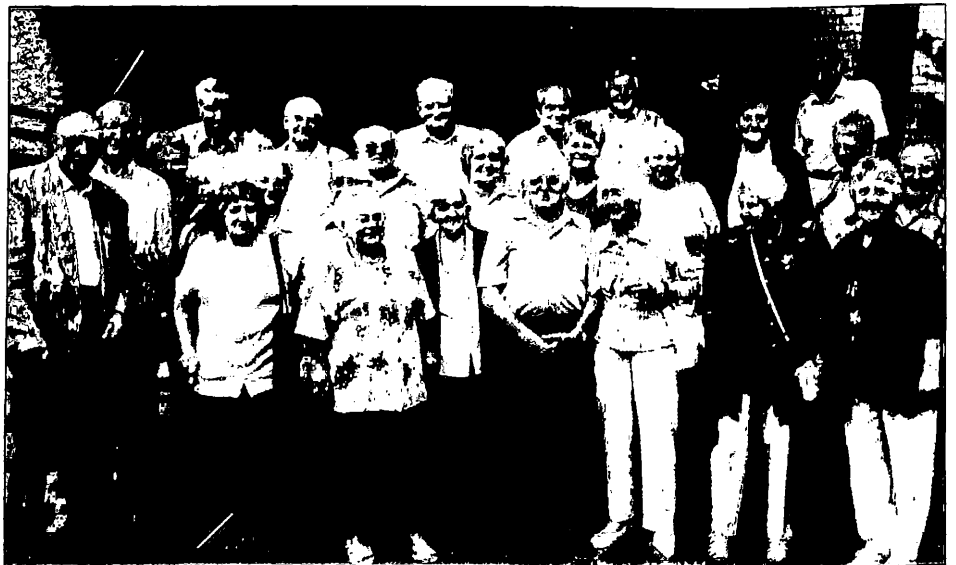
Leisersdorfer Treffen 2004. Drei Neunzigjährige waren mit dabei.