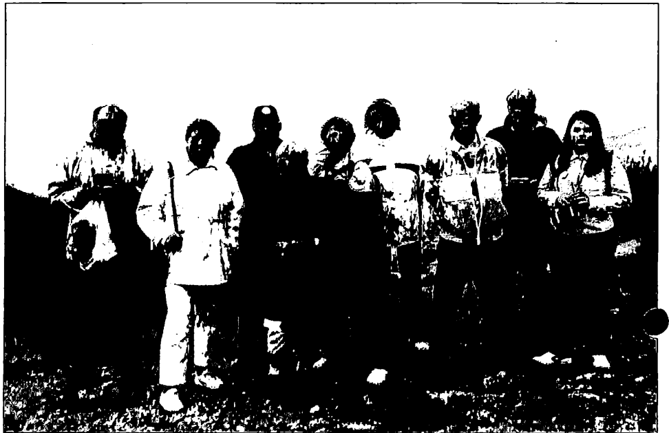
Das sind die Gipfelstürmer, die trotz eisigen Windes und empfindlicher Kälte die Schneekoppe erwanderten.