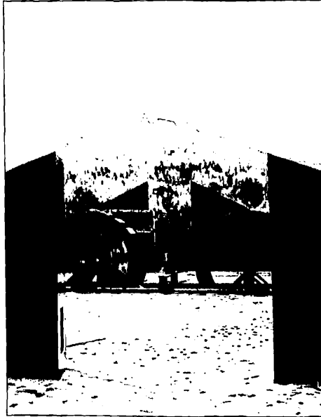
Merkwürdige Holzbauten sind am Fuß der Gröditzburg installiert worden. Hier soll von einer schwedischen Filmagentur ein Film über die Gröditzburg gedreht werden.

Bei meinem letzten Besuch auf der Gröditzburg im Juli 2003 war dieser Saal noch völlig kaputt, ein weiterer Aufstieg gesperrt. An der einen Wand stand eine Bauleiter und ein Elektrokabel hing aus der Wand heraus. Es sah aus, als seien Bauarbeiter einfach weggelaufen und hätten angefangene Arbeit einfach liegen gelassen.