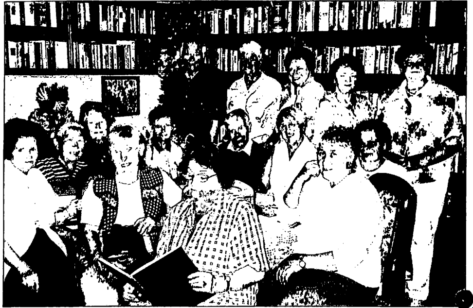
Viel über Hirschberg, seine Gnadenkirche und den schönen Ring, aber auch über das Leben der Deutschen, die nach dem Krieg in Hirschberg blieben, erfuhren die Fahrteilnehmer der diesjährigen Leserreise beim Deutschen Freundschaftskreis in Hirschberg.