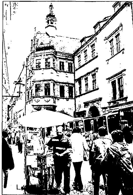
Nach der feierlichen Eröffnung des Schlesischen Museums zu Görlitz im Schönhof wurde ein fröhliches Museumsfest gefeiert, zu dem nicht nur Gäste, sondern auch viele Görlitzer kamen.

Während der Besucher die liebevoll zusammen getragenen Exponate schlesischer Geschichte betrachten kann, wird auch nicht der Eindruck des schönen Hauses beeinträchtigt. Da wirken Dachkonstruktionen in hellen Räumen, da führen Jahrhunderte alte Steintreppen in die oberen Ausstellungsräume, die alle festlich mit Rosen geschmückt waren. Man hatte das Gefühl, das alte Haus freue sich mit uns über den neuen Glanz. Es gab auch viele persönliche Aufmerksamkeiten, die diese Eröffnung begleiteten. So hatte ein Breslauer, der heute am Königstuhl lebt, den Lieblingswein von Gerhart Hauptmann nach Görlitz geschickt und er schmeckte hervorragend.