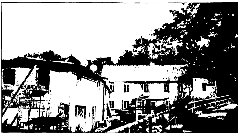
Jaaa sie steht noch, sie steht noch. Die Aufnahme wurde bei einer Reise nach Goldberg im Mai 2005 aufgenommen.