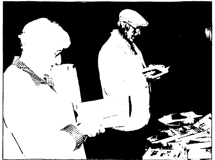
Das Heimatfreunde ganz vertieft beim Lesen und Stöbern am Stand der GOLDBERG-HAYNAUER HEIMATNACHRICHTEN.