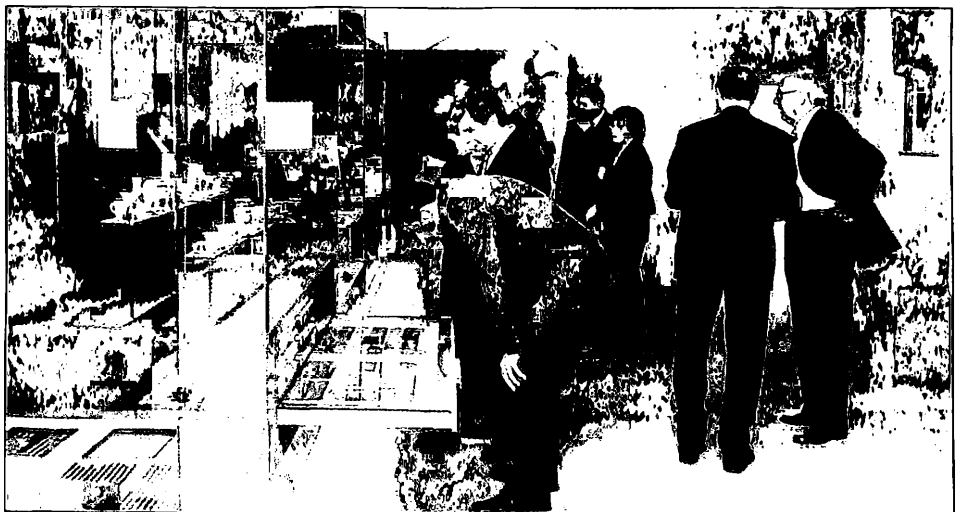
Die neue Dauerausstellung des Schlesischen Museums im Schönhof.