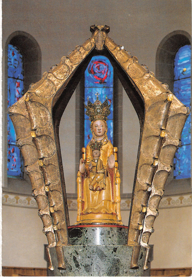
Gnadenbild Werl, 12. Jahrhundert – Foto Euler Werl Druck: Dietrich-Coelde-Verlag, Werl

Die letzten Jahre seines Lebens waren gekennzeichnet durch mancherlei Leiden und Altersbeschwerden. Im Frühjahr 1988 suchte er die Alten- und Pflegestation der Franziskaner in Warendorf auf. Dort rief ihn der auferstandene Christus am 4. April 1991, dem Donnerstag nach dem Osterfest, zu sich in die ewige Osterfreude. Er möge ruhen in Frieden.